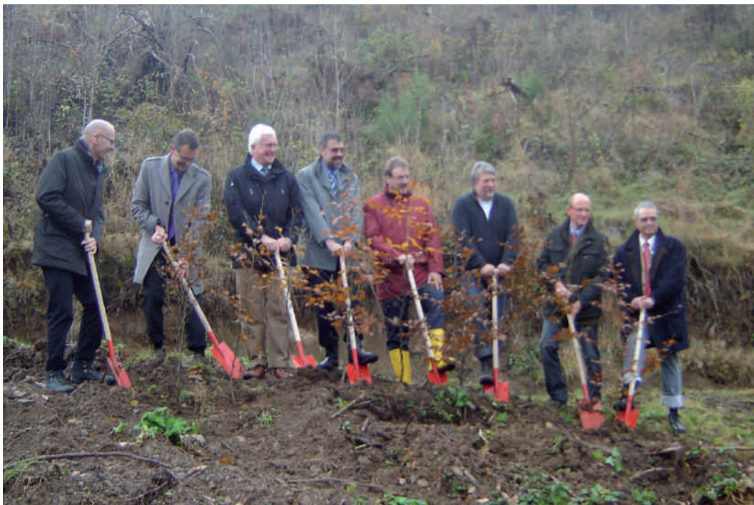
Vertreter der VR-Bank Nordeifel und die Bürgermeister starteten die Baumpflanzaktion.

Zu den gepflanzten Bäumen wird in jeder der sechs beteiligten Kommunen noch eine Infotafel aufgestellt, die über den ökologischen Nutzen informiert.