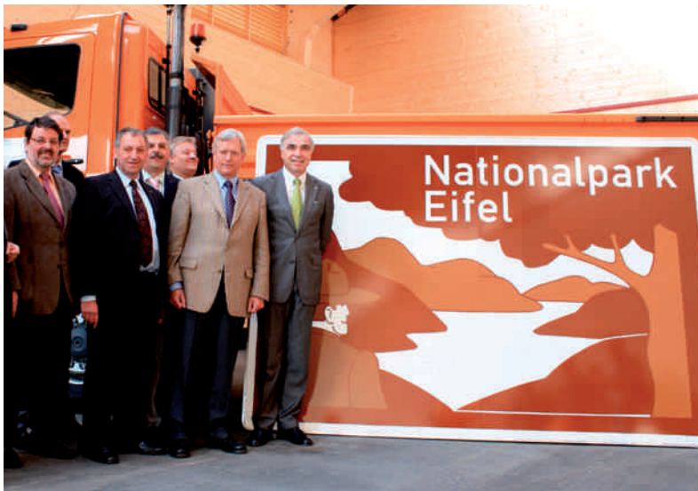
NRW-Umweltminister Eckhard Uhlenberg (2. v.r.) und Naturpark- Vorsitzender Günter Schumacher (1.v.r.) bei der Vorstellung des Autobahn- Schildes.

Bei der Übergabe hoben NRW-Umweltminister Eckhard Uhlenberg und Landrat Wolfgang Spelthahn (Kreis Düren) neben der Verkehrslenkung vor allem den Image- und Werbewert der beiden neuen Schilder hervor: Bei täglich durchschnittlich 70.000 Fahrzeugen auf der A 4 in diesem Bereich werden viele Menschen zum ersten Mal und viele Menschen regelmäßig auf den einzigen Nationalpark in NRW aufmerksam. Bereits in den letzten Jahren hat der Naturpark Nordeifel in Abstimmung mit der Nationalparkverwaltung und